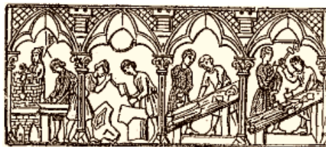
Maçons et tailleurs de pierre, Cathédrale de Chartres.

Le premier a l'air vraiment malheureux. Le deuxième ne semble ni heureux ni malheureux. Quant au troisième lui, il a l'air franchement heureux.